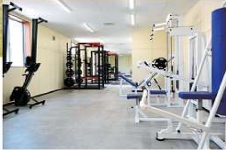
トレーニング室 (第2グラウンド内)