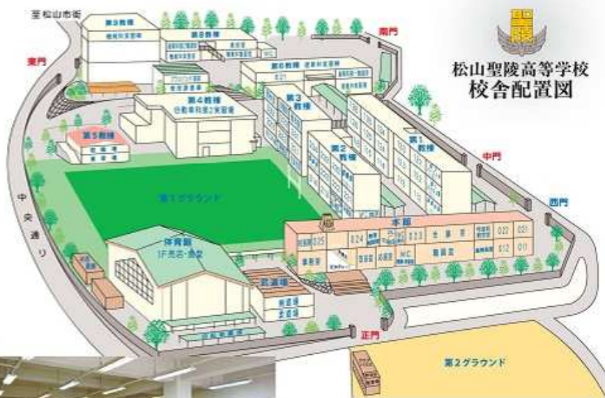
松山聖陵高等学校 校舎配置図