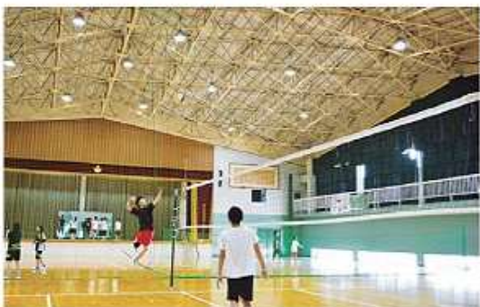
LED ライトを照明に利用 環境に配慮した体育館