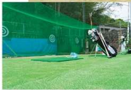
ゴルフ練習場 (第2グラウンド内)