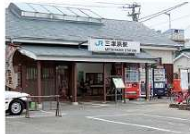
JR三津浜駅/JR通学生が利用する最寄りの駅 徒歩約15分