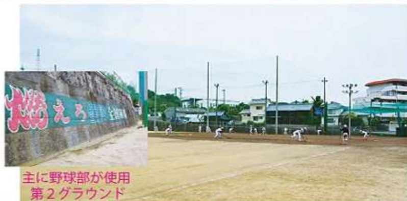
主に野球部が使用 第2グラウンド