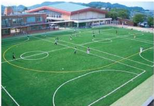
クラスマッチなどを行う 人工芝の第1グラウンド