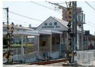
伊予鉄衣山駅/電車通学生が利用する最寄りの駅 徒歩約5分