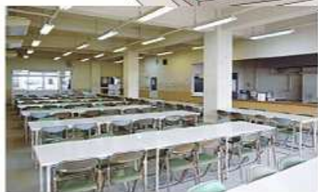
生徒に人気♪メニュー豊富な食堂 100席以上の食事スペースを確保