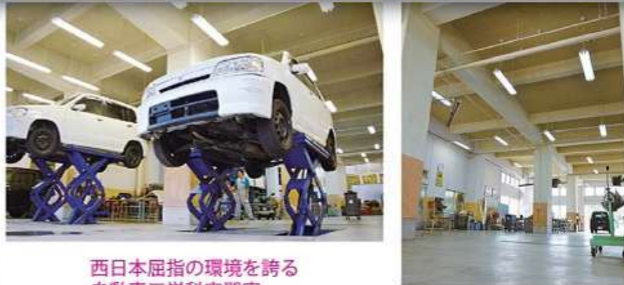
西日本屈指の環境を誇る 自動車工学科実習室